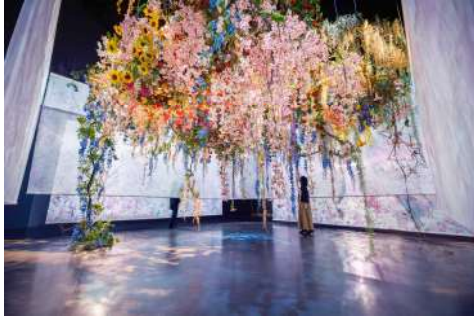
蜷川実花 《Sanctuary of Blossoms》 2024年

展覧会「蜷川実花展 with EiM : 儚くも煌めく境界」は、写真家・映画監督の蜷川実花が、データサイエンティストの宮田裕章、セットデザイナーのEnzo、クリエイティブディレクターの桑名功らと結成したクリエイティブチーム・EiMとの協働により実現する大規模な個展です。うつろう時間やながれゆく季節の境界を超える壮大なインスタレーションを発表するほか、蜷川が弘前をはじめ、日本各地で撮影した桜の写真など、人の手とまなざしに育まれた花や木々を捉えた作品群を紹介し