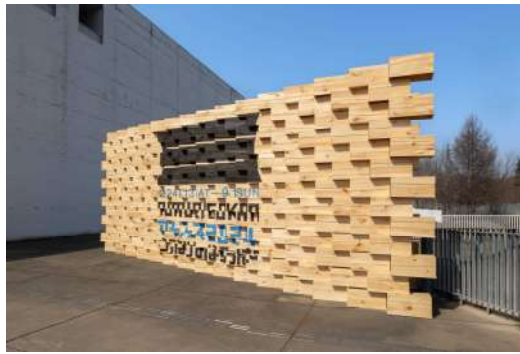
青木淳 《つながりのはらっぱ のための壁》