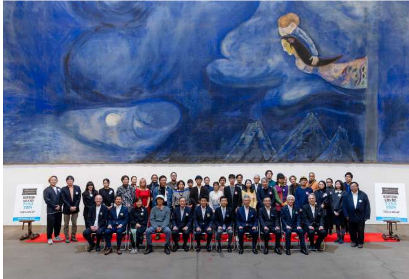
2024 年 4 月 12 日に開催したオープニングセレモニーでの集合写真

青森県初、県内の個性豊かな 5 つの美術館・アートセンター(青森県立美術館、青森公立大学 国際芸術センター青森、弘前れんが倉庫美術館、八戸市美術館、十和田市現代美術館)が連携し開催する「AOMORI GOKAN アートフェス 2024」が開幕しました。前日の 4 月 12 日(金)には青森県知事、開催 4 市(青森市、弘前市、八戸市、十和田市)の市長、館長、学芸員、アーティストらが参加しオープニングセレモニーが行われました。