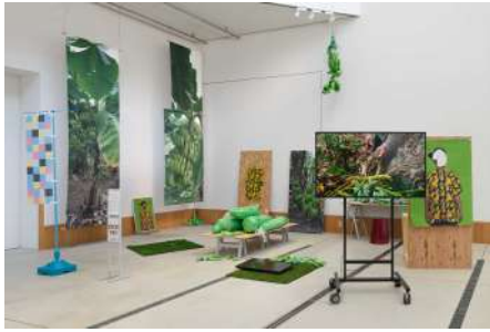
展示風景 東方悠平 《自由の像、不自由なバナナ》 2024年

訪れる人によって使い方が決められていく「はらっぱ」のような場でもあります。「はらっぱ」でもあり、「ファーム」でもあるこのジャイアントルームで、様々な作品や活動、そしてアーティストとの出会いをお楽しみいただけます。